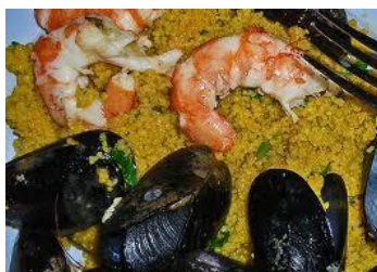
Couscous di mare

Il Cineforum è stato pensato ed attuato per cercare di andare incontro all' esigenza di conoscenza e di integrazione delle diverse etnie presenti sul nostro territorio.